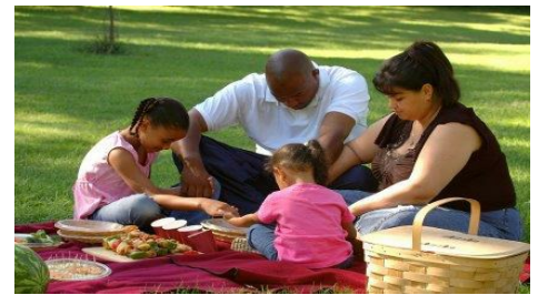
“...la FAMILIA que ORA unida PERMANECE unida.”

de que todas las relaciones son llamadas a ser sagradas y especiales. Recuerdeles la diferencia entre las situaciones seguras e inseguras. Usted recibirá una carta que le dará valiosa información para hablar con su hijos sobre las situaciones inseguras.